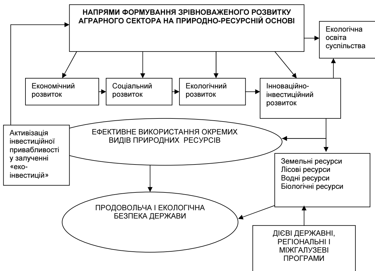
Рис. 1. Складові концептуального підходу зрівноваженого розвитку аграрного сектора на природно-ресурсній основі