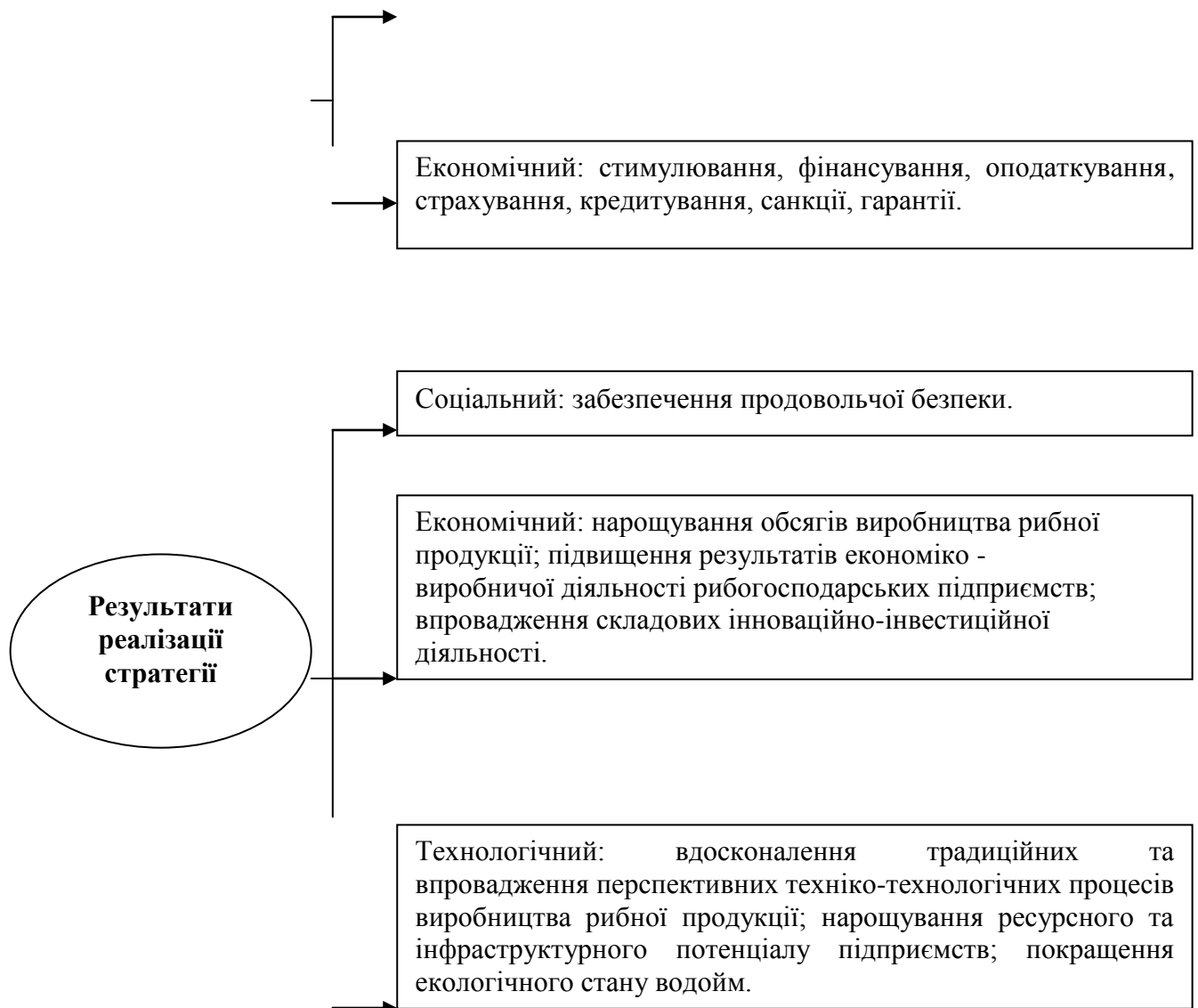
Рис. Стратегічні імперативи механізму інноваційного розвитку рибогосподарського комплексу.

Перспективний розвиток рибогосподарського комплексу підпадає під дію біфуркаційних (лат. bi – «два» та furca – «вила») механізмів. Це механізми, завдяки яким система (рибогосподарський комплекс) реалізує функції здійснення на основі поступової корінної зміни стану системи за рахунок отримання нею якісно нових станів, які втрачають характерні ознаки системи–попередниці при цьому зберігають з нею наслідкові зв'язки. Біфуркаційні механізми дозволяють досягти найбільш сприятливих умов для розвитку рибогосподарського комплексу, оскільки, забезпечуючи незворотність