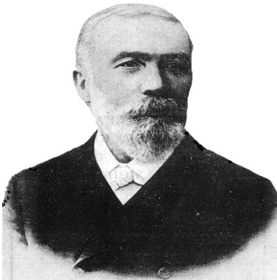
Рис.1. І.В. Пулюй

Іван Павлович Пулюй (2.02.1845 – 31.01.1918) (рис.1.). У 1881 році на Міжнародній електротехнічній виставці демонструє лампу (трубку) Пулюя, за яку був нагороджений срібною медаллю цієї виставки. З допомогою цієї катодної трубки, яка випромінювала невідомі промені Пулюй зафотографував зломану руку 13-ти річного хлопця, руку своєї дочки, скелет мертвого хлопчика. Основним колом його наукових інтересів завжди була фізика.