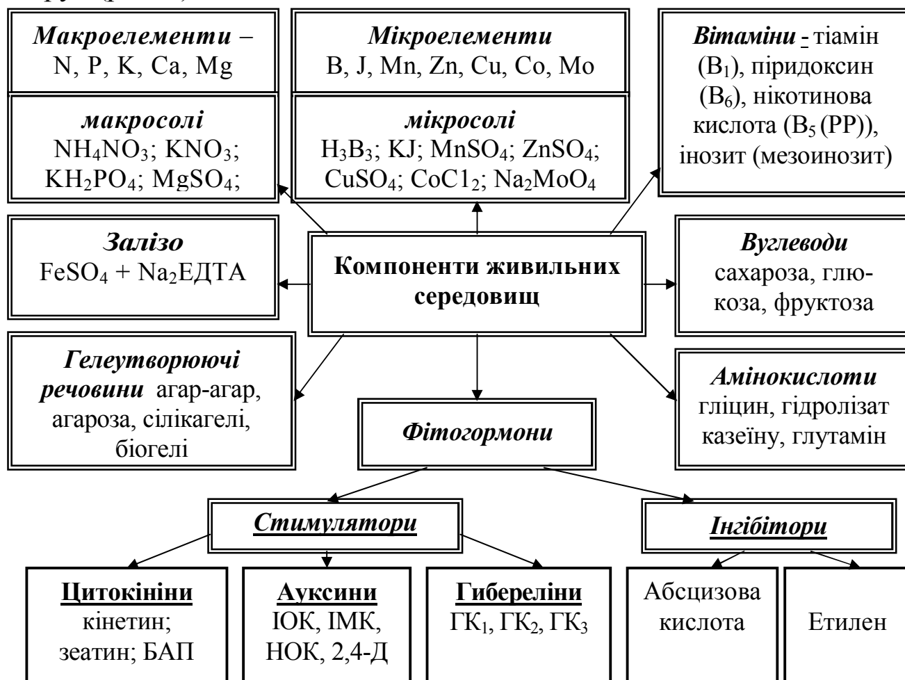
Рис. 1. Компонентний склад живильних середовищ для культивування тканин рослин

потребами. Усі компоненти живильних середовищ можна поділити на 8 груп (рис. 1).