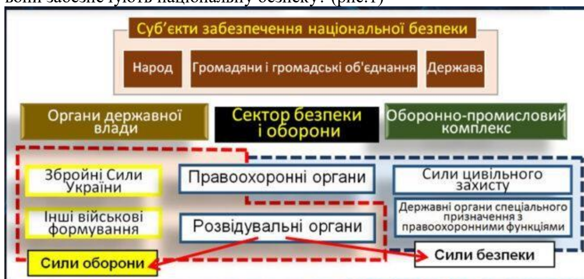
Рисунок 1 – Суб'єкти забезпечення національної безпеки України

Завдання 1. Дайте характеристику кожному суб'єкту забезпечення національної безпеки. Яким чином та на підставі яких нормативних актів вони забезпечують національну безпеку? (рис.1)