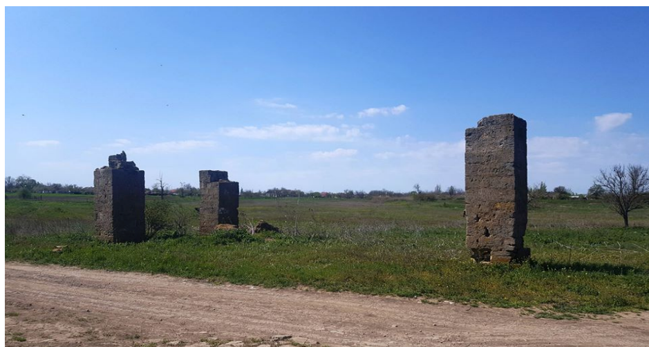
Фото 4. Колодязь у селі Білозірка.

Таке рішення було ухвалене в серпні 2020 року.