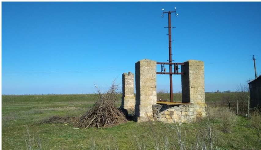
Фото 4. Колодязь у селі Прибузькому

Із офіційної інформації ми знаємо, що до 1930 року на місці сучасного села існував хутір, на якому мешкало 30 осіб, і належав він до села Пузирі. Капітальних будівель (хат) на хуторі не було, люди жили у землянках. Хутір був першим відділком колгоспу імені Косіора. Після 1930 р. хутір став частиною радгоспу імені Андре Марті. Але, це не єдиний колодязь у Прибузькому. Минулого року ми записали відео із місцевою мешканкою. Бабця похилого віку нам розповіла, що на західній околиці села є ще один такий самий колодязь, але без наземних споруд, залишилася лише шахта.