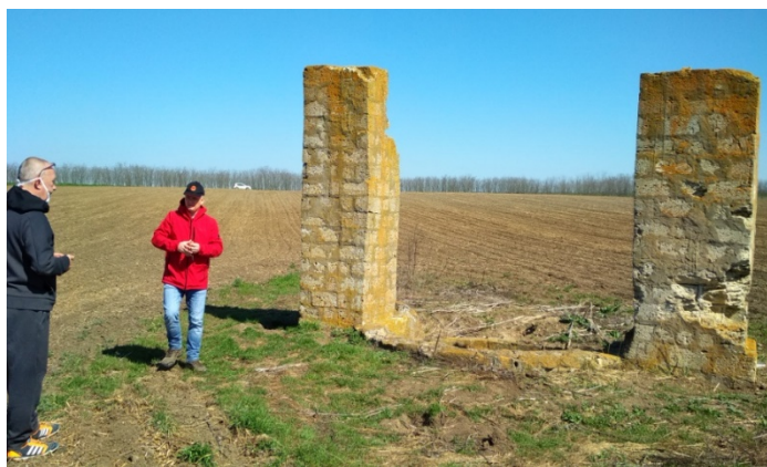
Фото 3. Колодязь у місцевості «Пилипиха», на кордоні Вітовського району Миколаївщини та Білозерського району Херсонщини.

Окрім «Пилипихи» (згідно з картою Херсонського повіту за 1910 рік) вздовж Вовчої балки знаходилося ще 13 хуторів. До середини 30-х років жодного з хуторів не залишилося. Щоб перевірити наскільки правдивою є версія лупарян, ми дослідили карту Шуберта 1869 року. Виявилось, що дійсно у Вовчій балці на той час вже існували два хутори, шість так званих скотних дворів, тобто будівель із загонами де утримували худобу, і один колодязь біля хутора Васильченка.