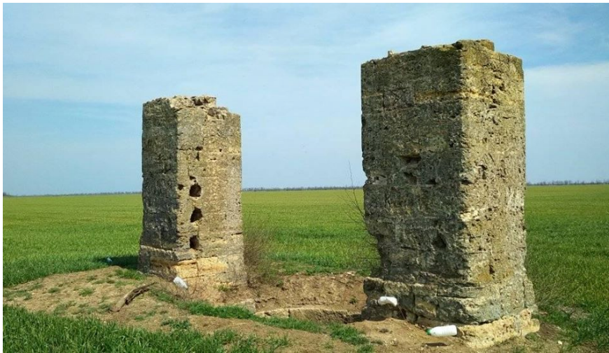
Фото 2. Троїцький (Малакановий) колодязь.

Отже, перший з них Троїцький (Малакановий), або Турецький колодязь (фото 2). Лежить на півночі Вітовського району у полі, між селами Калинівка і Костянтинівка. Ззовні обабіч шахти стоять дві кам'яні опори – бики, третя опора не зберіглася. Місцезнаходження колодязя обумовлене тим, що у 19 ст. поряд пролягала дорога.