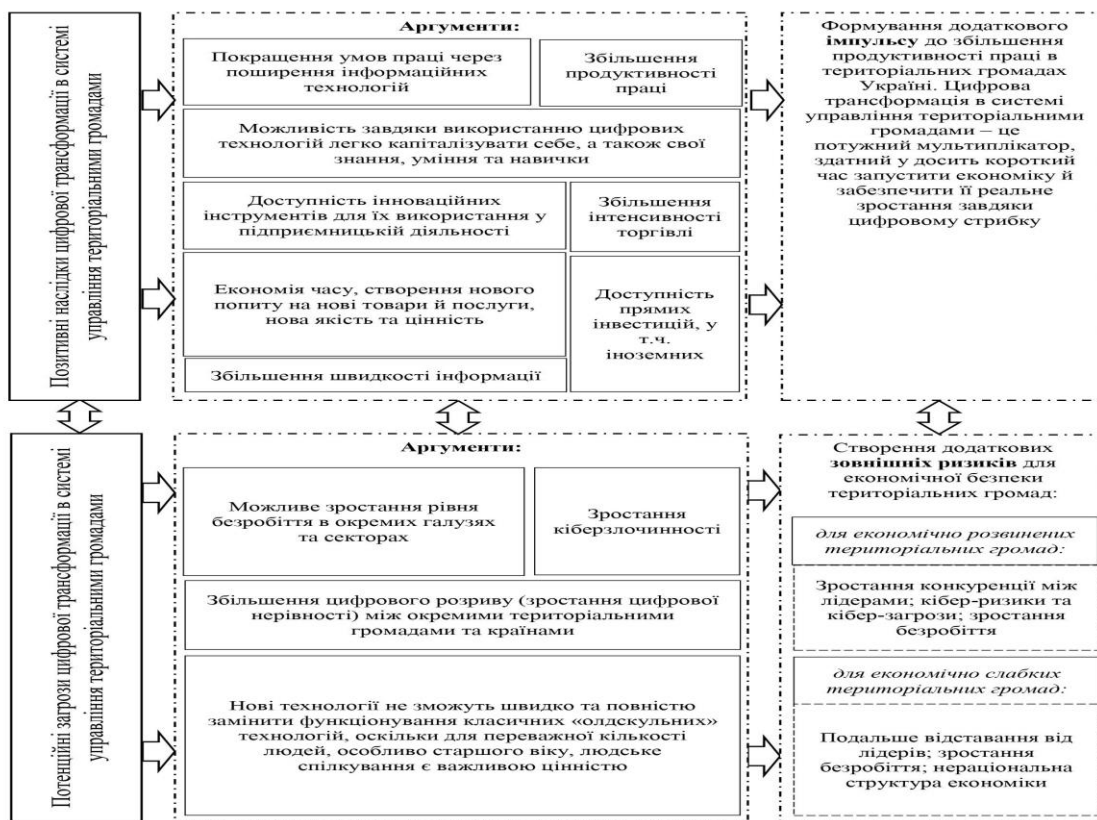
Рис. 1. Архітектура наслідків цифрової трансформації в системі управління територіальними громадами у контексті впливу на рівень їх фінансово-економічної безпеки

державотворення та державного управління, а також до місцевого самоврядування шляхом широкого застосування інформаційно-комунікаційних технологій у демократичних процесах.