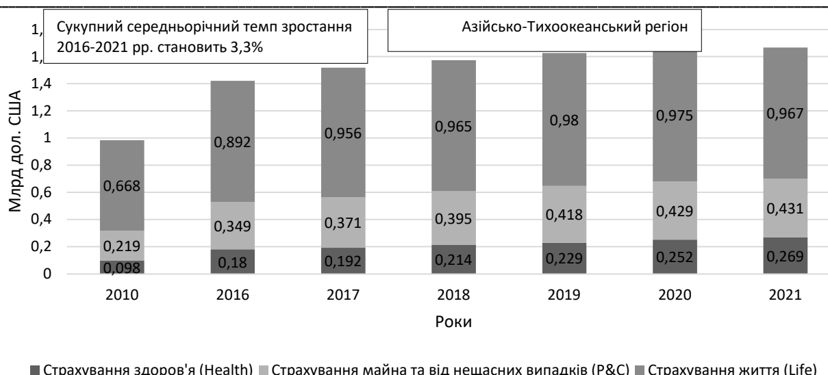
Продовження рисунку 1 – Динаміка зростання страхових премій, 2010-2021 рр.

Джерело: узагальнено автором на основі [9; 10; 11; 12]