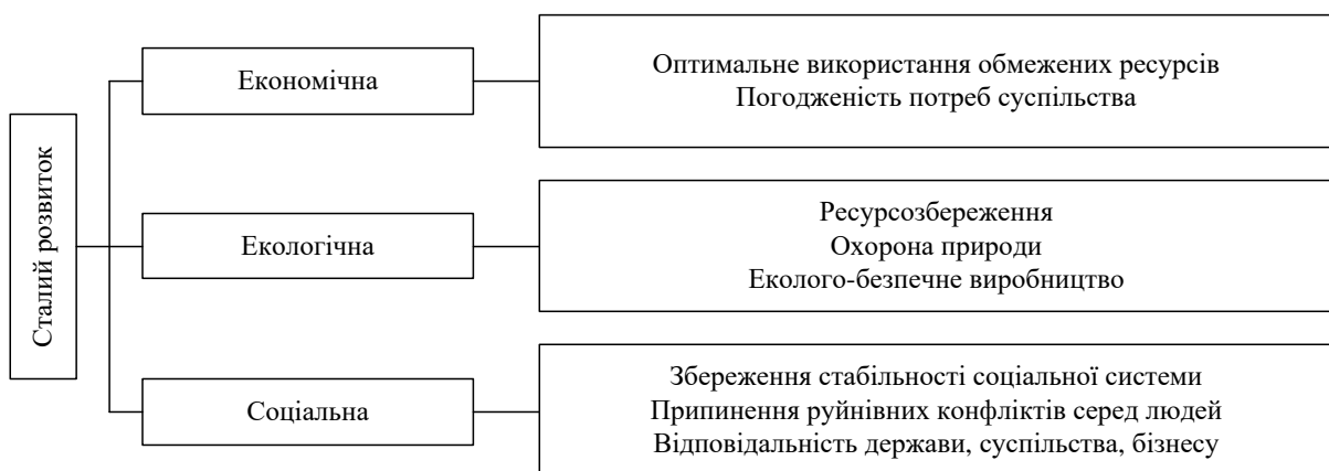
Рис. 2. Основні складові сталого розвитку (авторська розробка)

З екологічної точки зору, сталий розвиток забезпечує цілісність біологічних і фізичних природних систем. Особливе значення має життєздатність екосистем, від яких залежить глобальна стабільність всієї біосфери. Основні складові сталого розвитку подано на рис. 2.