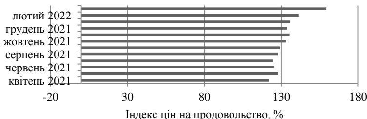
Рис. 1. Індекс цін на продовольство, %

фоні зростаючого безробіття (рис. 2) свідчить про негативні тенденції у формування економічної компоненти продовольчої безпеки.