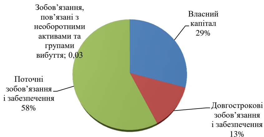
Рис. 2. Структура пасивів балансу національної економіки у 2021 р.

Якісний аналітичний інструментарій та виявлення важливих тенденцій у змінах ключових показників звітності на макрорівні дозволяють, з одного боку, будувати стратегічні плани і програми, та, з іншого боку, - забезпечити більш детальний розгляд специфіки практичного впровадження економічної діагностики підприємствами на основі їх звітної