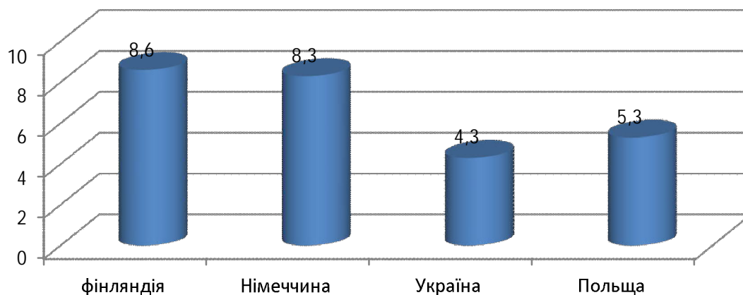
Рис. 1. Індекс прав власності в Україні та розвинених європейських країнах

нашої країни є нижчим, порівняно з Фінляндією, Німеччиною та Польшею (Рис. 2).