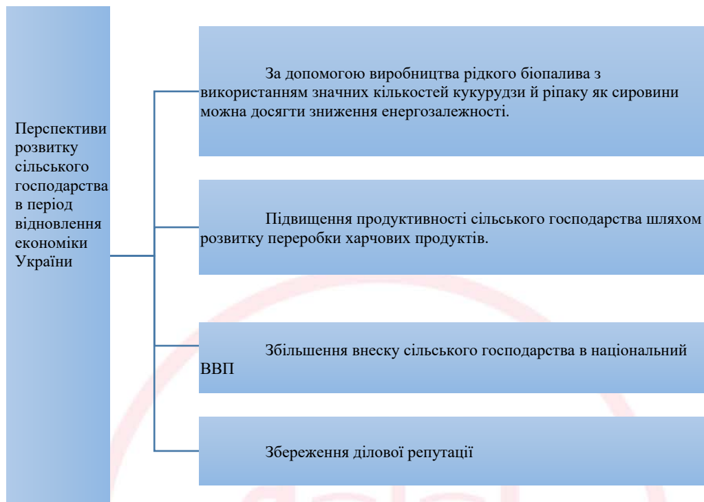
Рис. 2. Перспективи розвитку сільського господарства в післявоєнний період