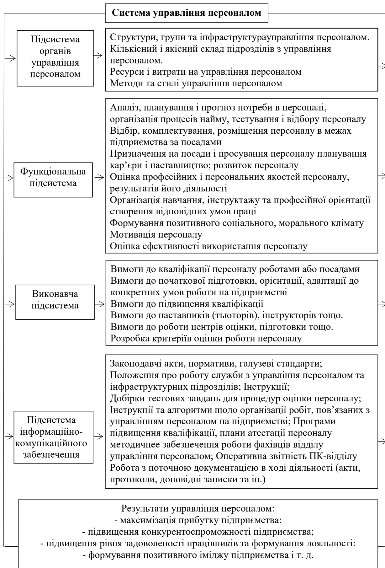
Рис. 1.1 – Склад підсистем системи управління