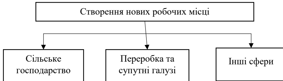
Рис. 2. Створення нових робочих місць

підприємствам які знаходяться на даних територіях бути більш конкурентоспроможними. Ми вважаємо, доцільним впровадження таких заходів, адже це допоможе збільшити економічний розвиток територіальних громад та покращити якість життя місцевих мешканців.