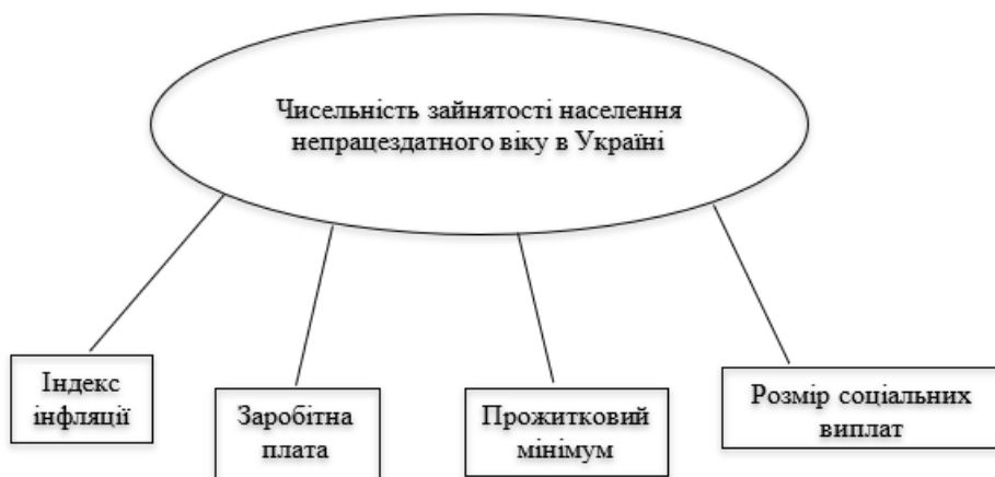
Рис. 2. Фактори, які впливають на чисельність зайнятого населення працездатного віку

На рис.1 показано динаміку зайнятості осіб. Як видно з графіка, зайнятість цих осіб зменшилась. З 2015 по 2021 рік прожитковий мінімум зріс у 1,5 рази. Це свідчить про те, що зросла мінімальна вартість набору продуктів харчування, необхідних для забезпечення нормального функціонування організму людини, збереження його здоров'я, а також набору непродовольчих товарів та послуг, необхідних для задоволення основних соціальних і культурних потреб людини. Однак рівень зайнятості населення працездатного віку за період з 2016 по 2021 рік зменшився в 1,3 рази, що свідчить про недостатній рівень життя. Тому важливо проаналізувати зайнятість працездатного населення та її пряму залежність від факторів, що впливають на рівень зайнятості. Економічні фактори, які можуть впливати на рівень зайнятості, показані на рисунку 2.