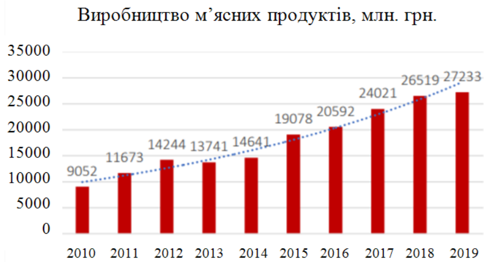
Рис. 2. Динаміка виробництва м'ясних продуктів в Україні

Виробництво м'ясних продуктів в Україні щороку зростає, в основному це пов'язано із тим, що ці продукти є традиційними для українців і вони користуються широким попитом серед всіх верств населення (рис. 2) [4, 5].