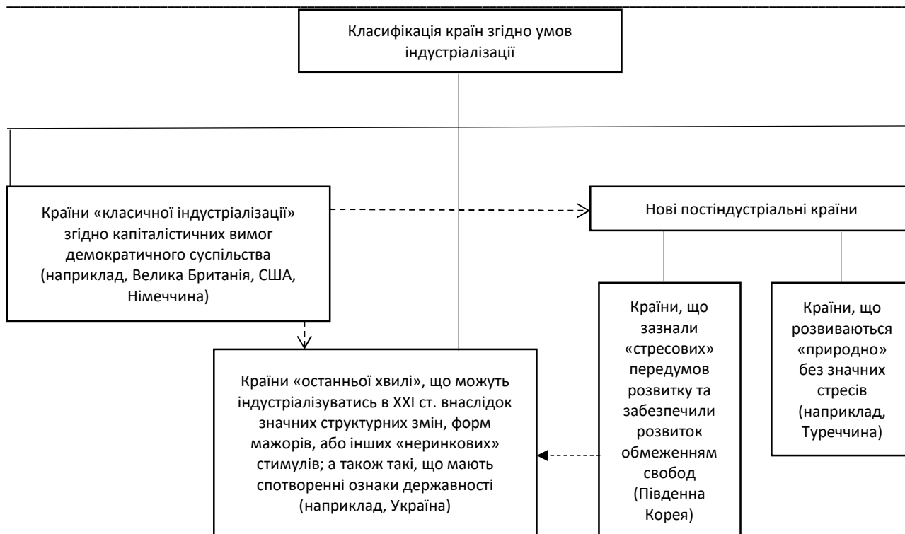
Рисунок 1 – Класифікація країн згідно умов та передумов індустріалізації