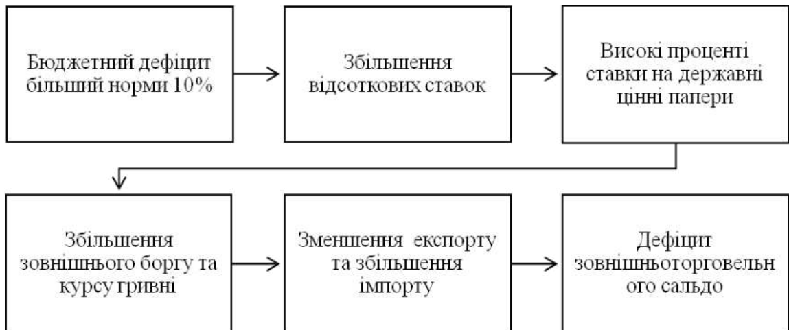
Рисунок 2 — Наслідки дефіциту бюджету для економіки України