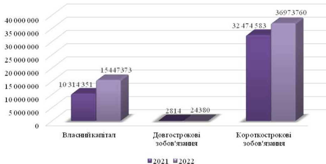
Рис. 2. Динаміка джерел фінансування ТОВ «Кернел-Трейд» у 2021-2022 рр., тис. грн

Звернемо увагу на динаміку джерел фінансування для залучення активів (рис. 2).