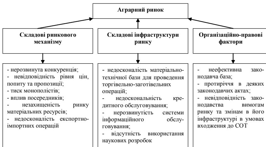
Рис.1. Фактори негативного впливу на формування аграрного ринку

Спробуємо згрупувати фактори негативної дії та виявити основні напрямки мінімізації їх впливу на діяльність сільськогосподарського підприємства (рис.1.).