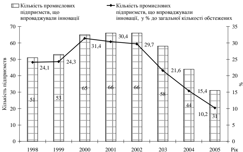
Рис.1. Кількість інноваційно активних підприємств Миколаївської області

цілому по Україні (8,2% інноваційно активних підприємств). Зважаючи на високу конкурентність суб'єктів господарювання іноземних держав, Україна в недалекому майбутньому ризикує втратити виробничу незалежність та перетворитися на сировинний придаток до більш розвинених країн.