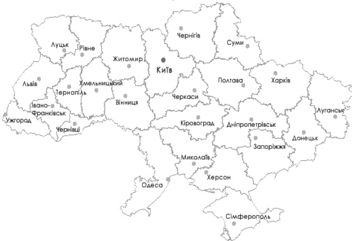
Рисунок 3.1 - Контурна карта України

Завдання 3. На контурній карті зобразити економічні райони за: Ф. Заставним, В. Поповкіним, М. Пістуном, Є. Качаном.