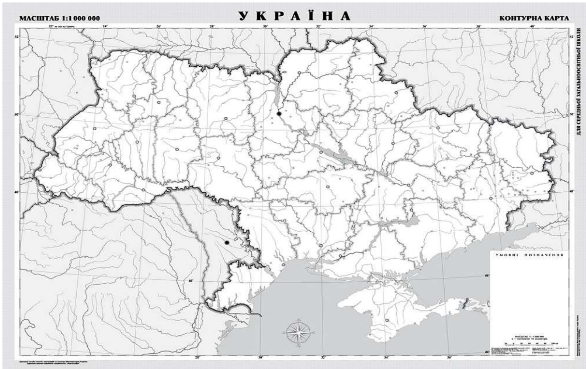
Рис 1.2. Контурна карта України