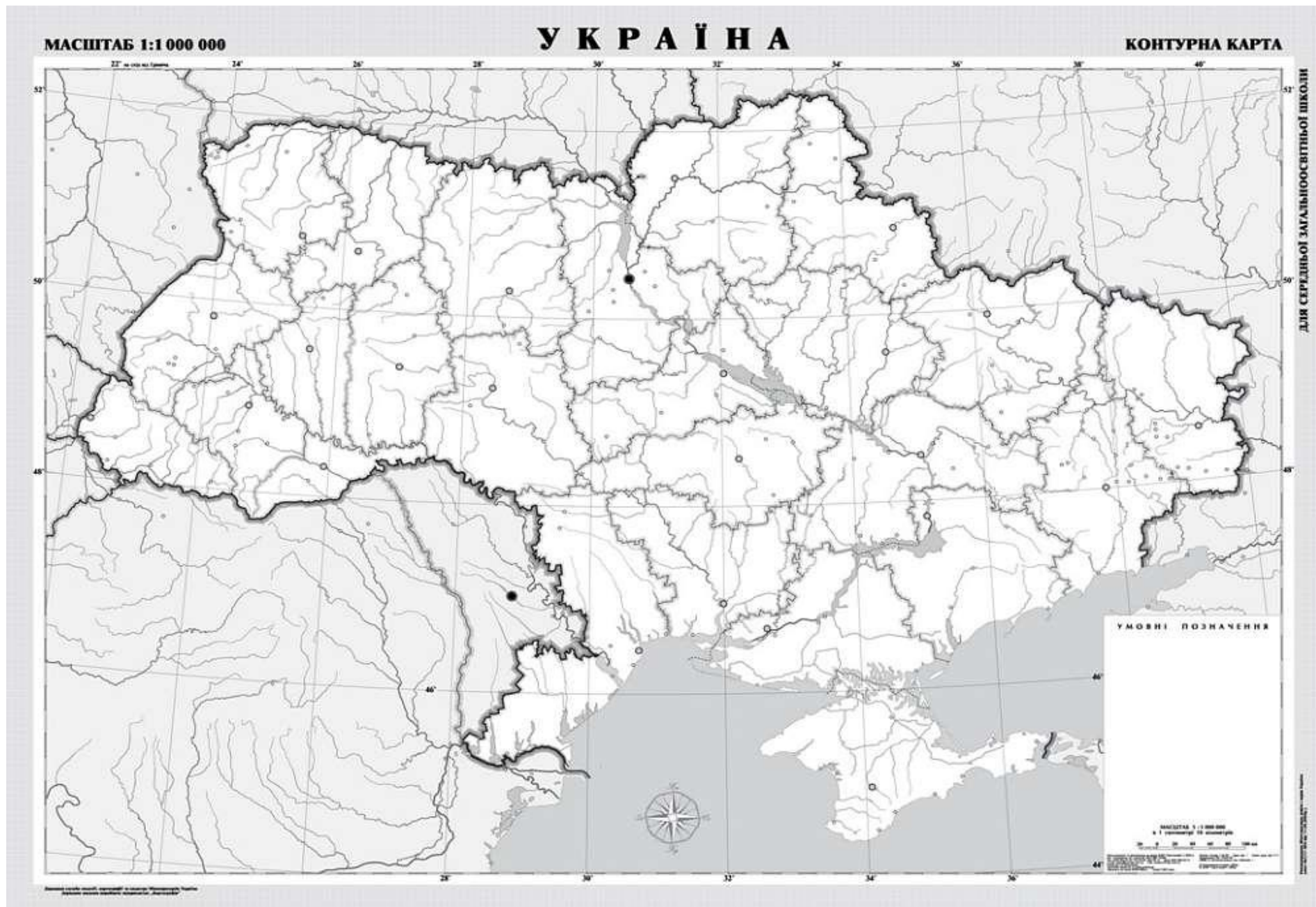
Рис. 6.2. Контурна карта України