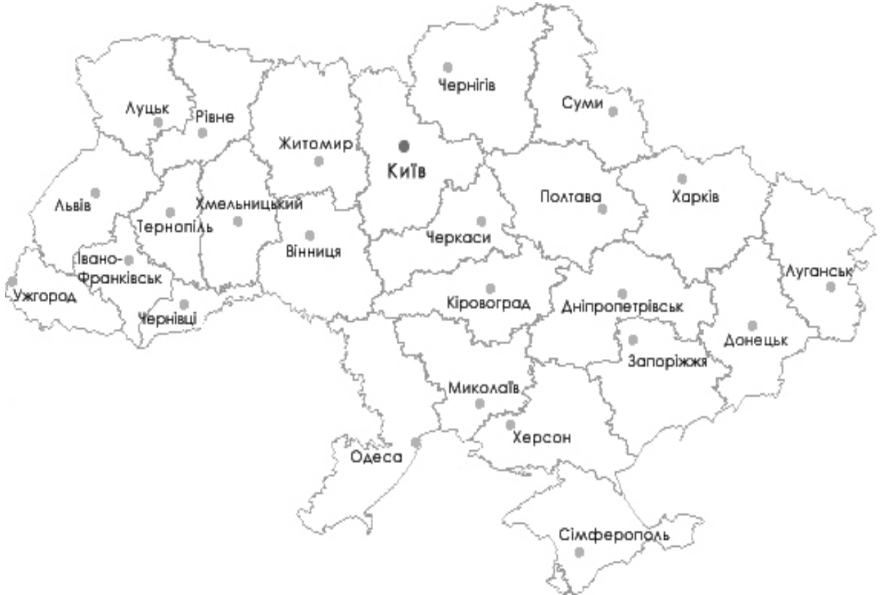
Рисунок 7.1. – Контурна карта України.

Завдання 8. Промислові запаси вугілля в Україні, які знаходяться в трьох вугільних басейнах, оцінюються в 48,6 млрд. т. Обчисліть, на скільки років вистачить країні вугілля при умові, що його видобуток становитиме 100 млн. т. на рік.