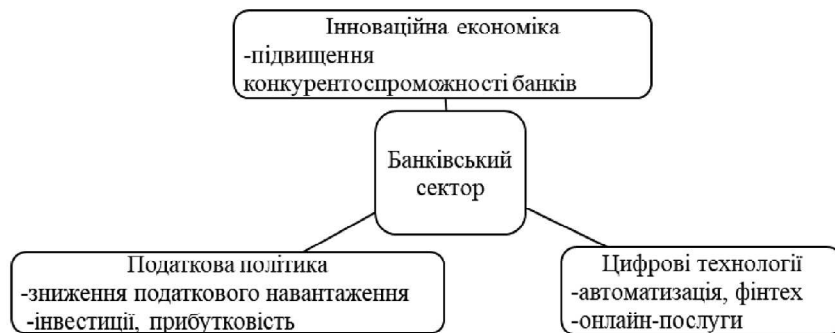
Рис. 1. Взаємозв'язок між податковим стимулюванням, цифровізацією та розвитком банківського сектору