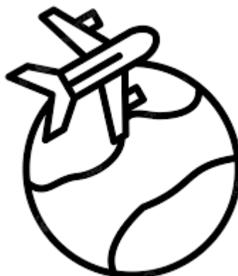
«Рисунок 3.1 – Назва рисунку

Якщо ілюстрації створені не автором, то, подаючи їх до звіту, треба дотримуватися вимог чинного законодавства про авторські права. Ілюстрація позначається словом «Рисунок __», яке разом з назвою ілюстрації розміщують після пояснювальних даних, наприклад: