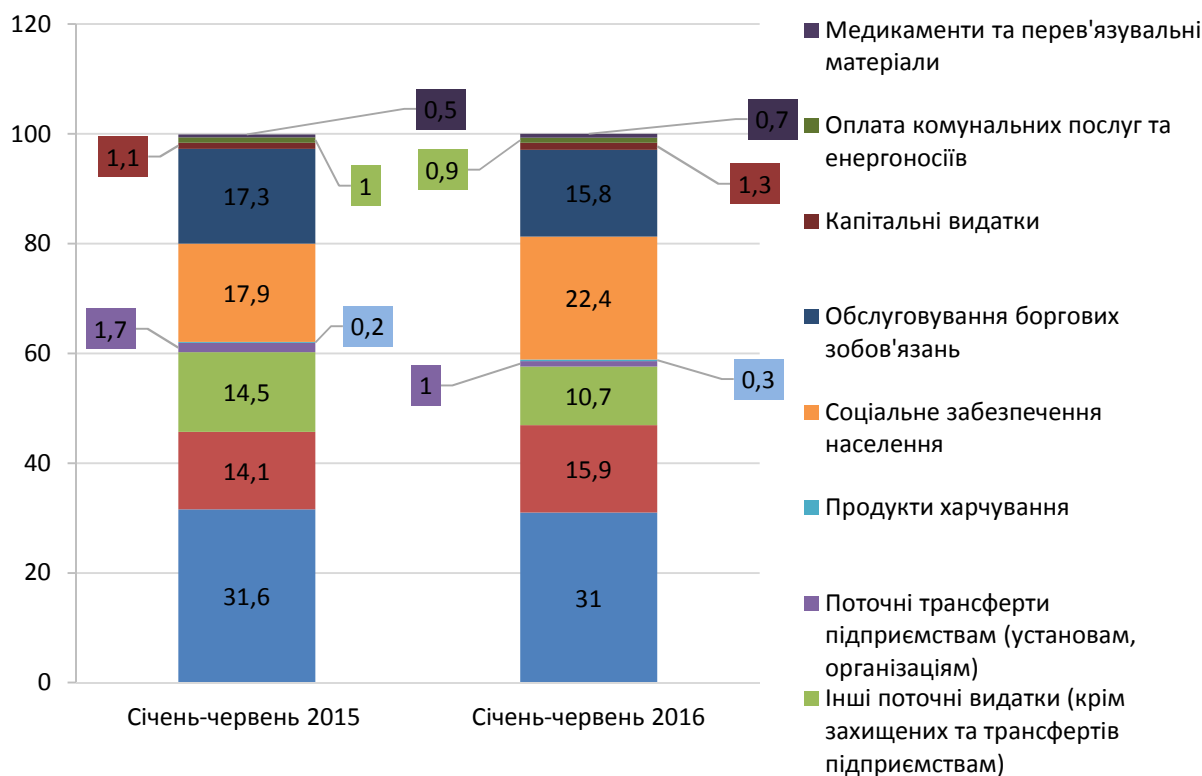
Рисунок 2 – Структура видатків державного бюджету у 2015-2016 рр. у розрізі їх економічної класифікації

Вищезазначене вплинуло на зміни часток цих видатків у загальному їх обсязі, що наведено на рис. 2.