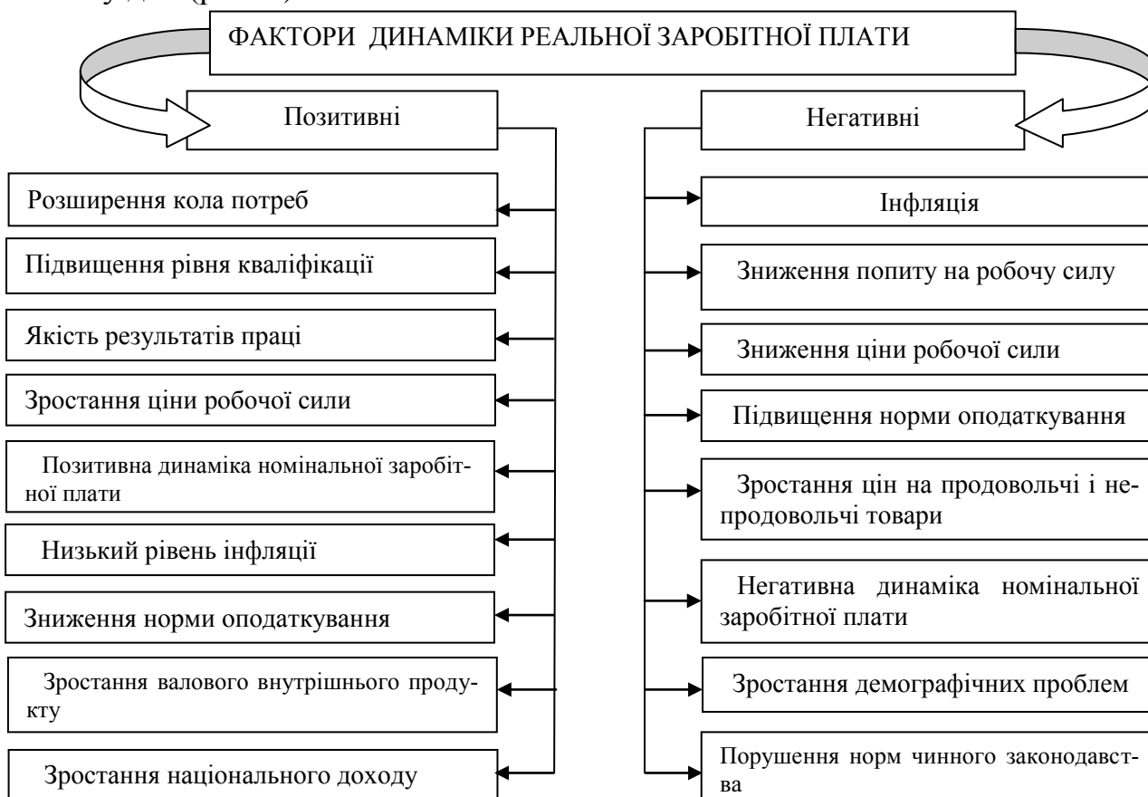
Рис. 3. Чинники, що впливають на рівень реальної заробітної плати

На рівень реальної заробітної плати впливають фактори, які мають протилежну дію (рис. 3).