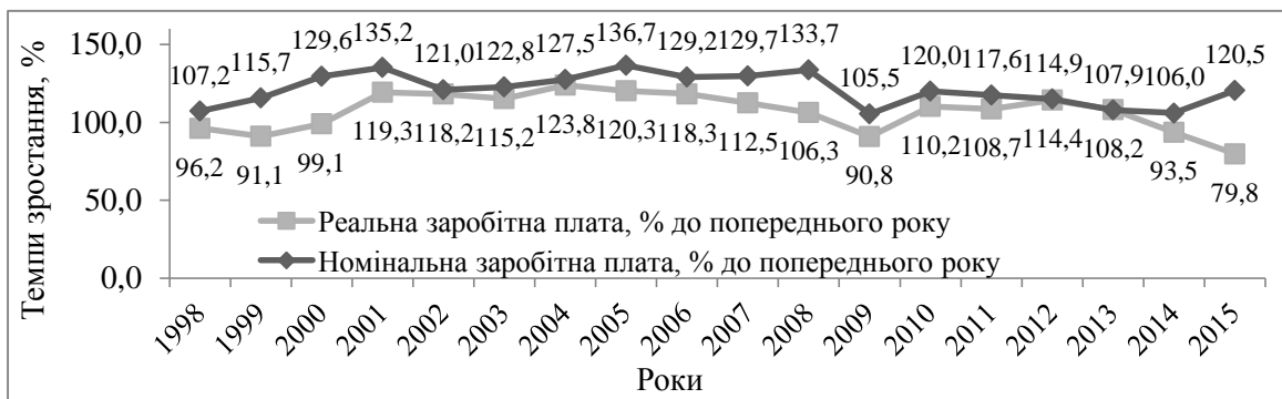
Рис. 2. Динаміка номінальної та реальної заробітної плати в Україні