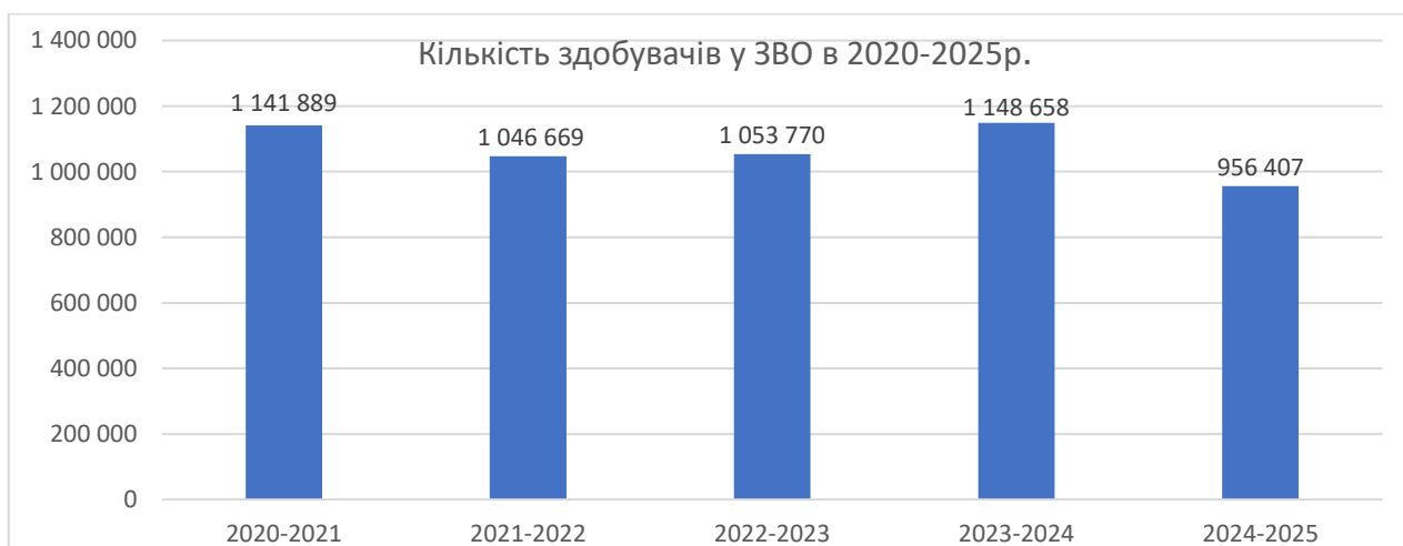
Рисунок 2 – Кількість здобувачів у ЗВО в 2020-2025 навчальних роках

Відтак, маємо такий графік кількості здобувачів у ЗВО у 2020-2025 роках (рис. 2). Як бачимо, спостерігається різке падіння у 2021-2022 році, близько -8,34% або 95 220 осіб, що є наслідком війни та пандемії. У 2022-2023 роках відбувається незначне відновлення у вигляді +0,68% або 7 101 осіб, освітня система набуває адаптаційного характеру щодо воєнних умов. Період з 2023 по 2024 характеризується значним зростанням близько +9,00% або 94 888 осіб, процес вступної кампанії починає стабілізуватись у порівнянні з 2020-2021 роком. Вже у період з 2024 по 2025 рік відбувається катастрофічне падіння, майже на 192 251 осіб менше, що становить -16,74% темпу приросту, найбільше скорочення за весь період. що пов'язане з багатьма факторами.