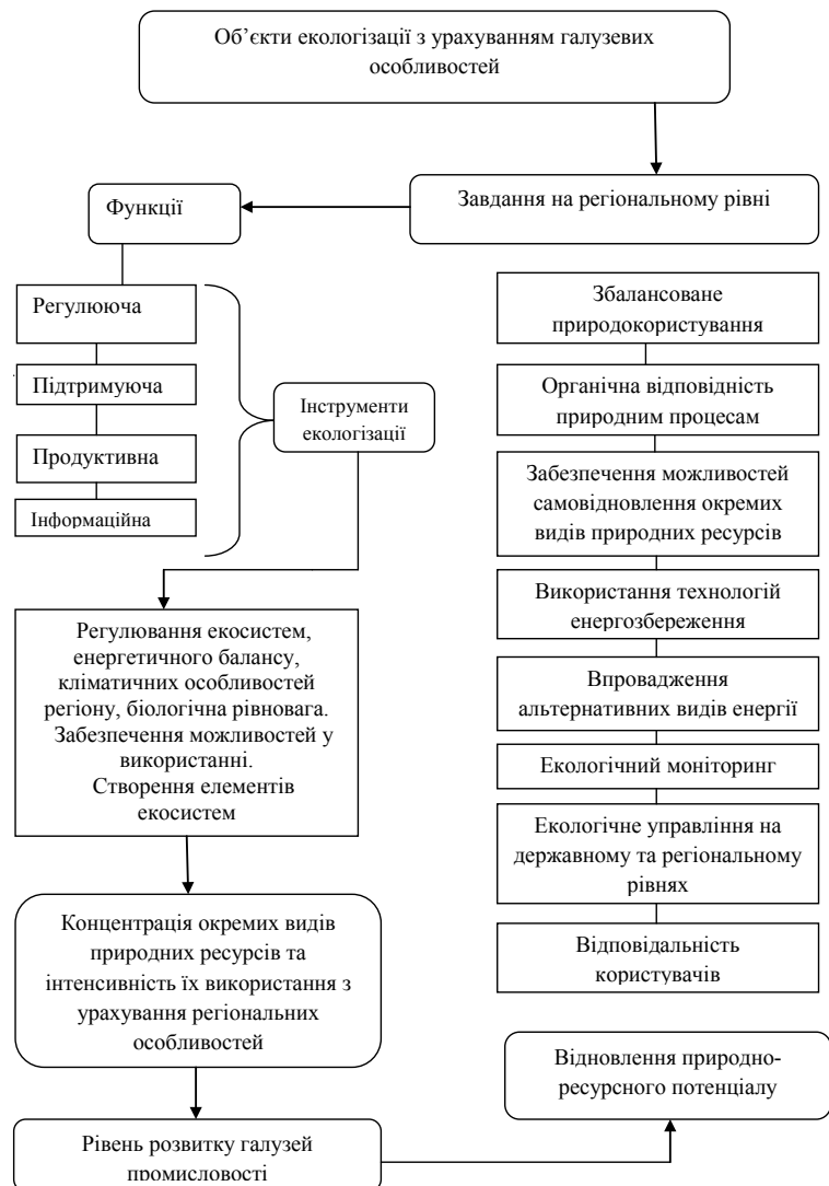
Рис. 1. Сутність екологоорієнтованого підходу у регіональному розвитку

Принциповим є аспект зміни правил взаємодії центру та регіонів як у частині бюджетних взаємовідносин, так і у сфері підтримки регіональних ініціатив на користь останніх. Відсутність відповідного механізму у цій сфері призводить до значних структурних диспропорцій як регіонального, так і загальнонаціонального масштабу. Виявлено, що головним механізмом,