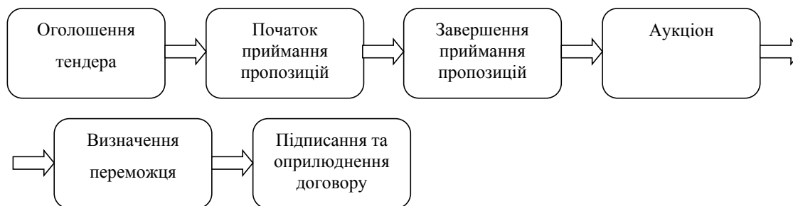
Рис. 2. Процес державних закупівель через систему “ProZorro”