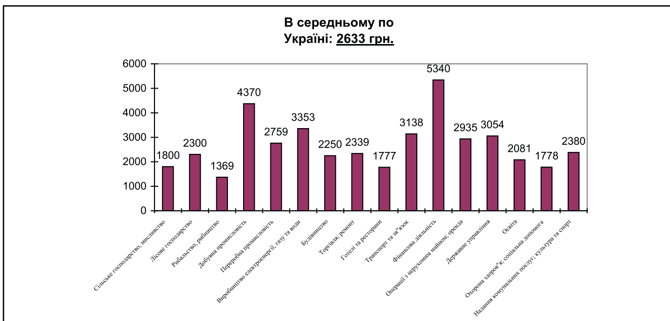
Рисунок 2. Середньомісячна заробітна плата штатних працівників за видами економічної діяльності у 2011 році, грн.