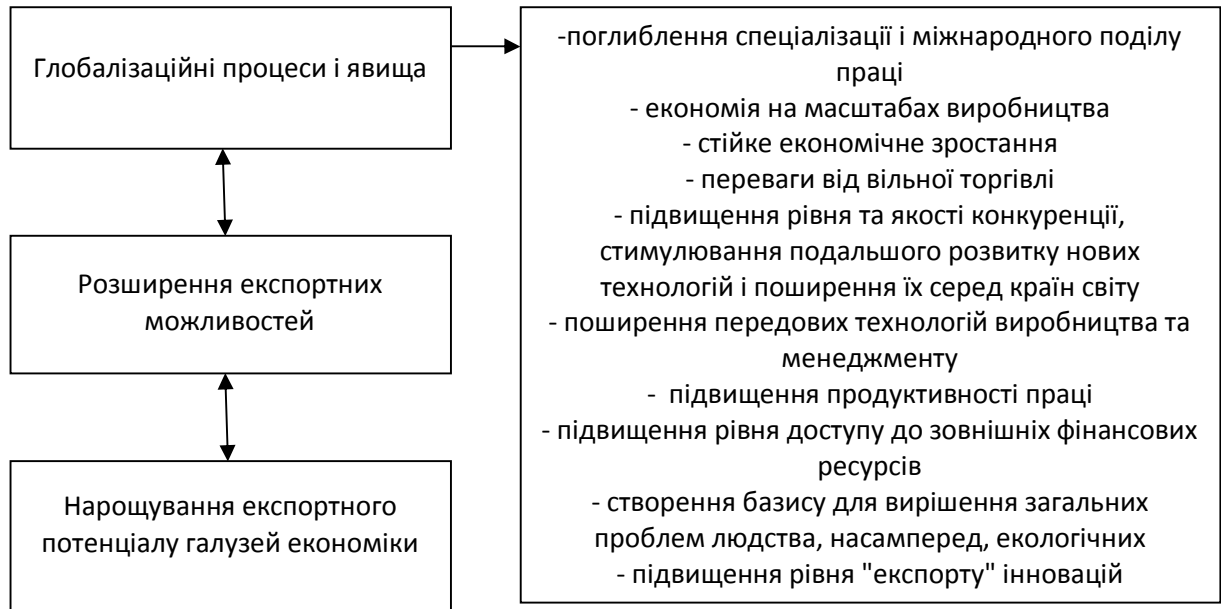
Рисунок 1 – Позитивні наслідки глобалізаційних процесів і явищ у розвитку національної економіки держави

Процес формування єдиного світового господарського простору є багатограним і суперечливим.