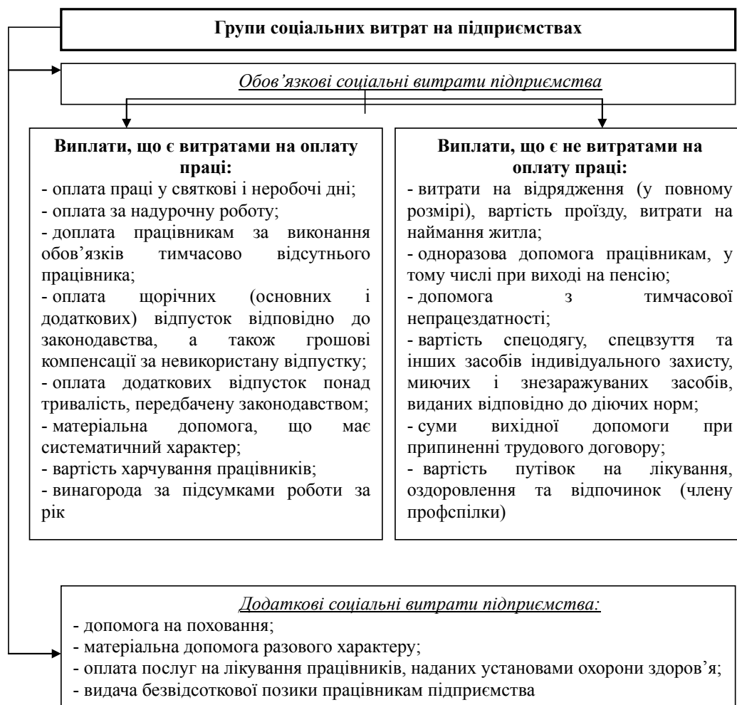
Рис. 1. Групи соціальних витрат на підприємстві

Визначеного нормативними документами порядку документування для цієї ситуації