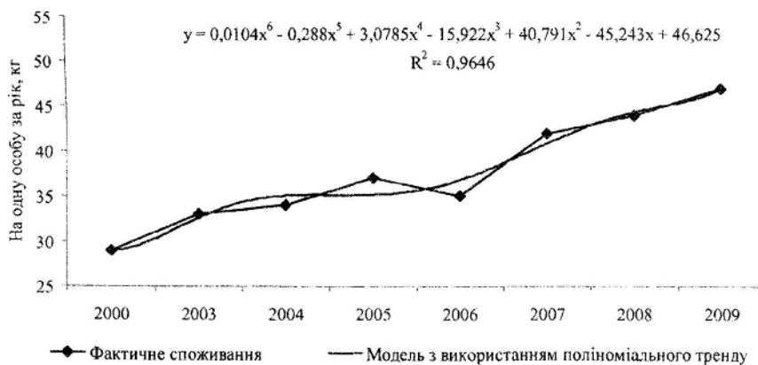
Рис. 2. Динаміка споживання молока і молочних продуктів в Україні, 2000-2009 рр.

Застосування поліноміального тренду й методу експоненціального згладжування (рис. 3) за формулою (1) дає змогу спрогнозувати споживання фруктів, ягід і винограду в Україні на: