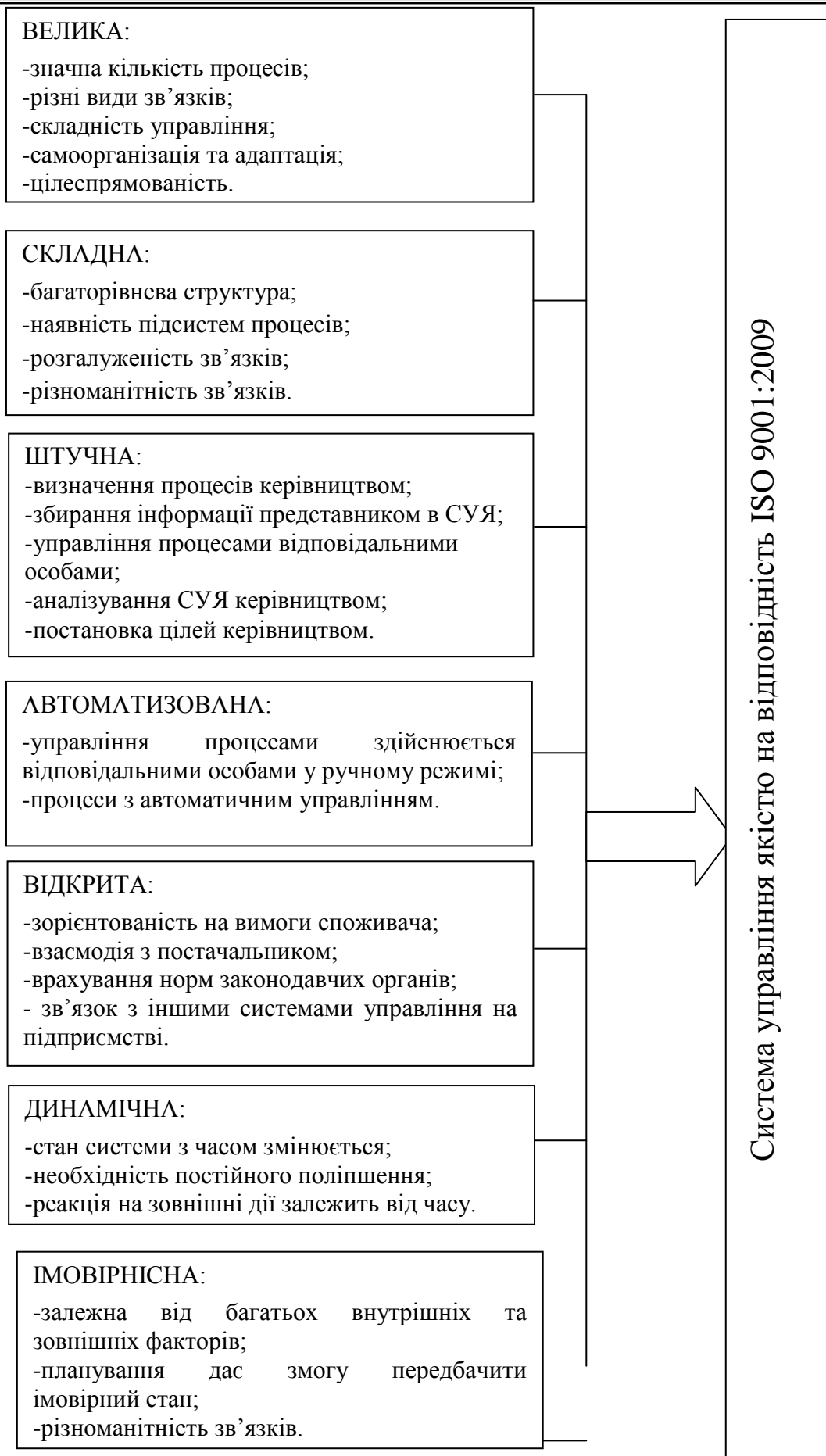
Рис.2. Результати аналізу СУЯ за ознаками класифікації систем