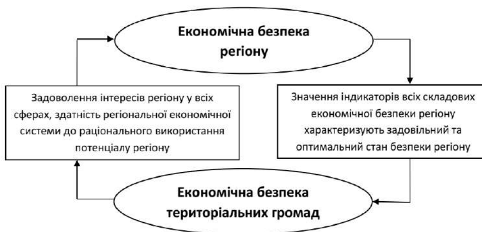
Рисунок 1 – Схема економічної безпеки регіону

Економічна безпека регіону (рис. 1) характеризується захищеністю регіональної економіки та економічних інтересів територіальної громади від дії дестабілізуючих чинників, узгодженістю інтересів регіону в економічній, соціальній та екологічній сферах, здатністю регіональної економічної системи до самовідтворення і раціонального використання економічного потенціалу регіону під час задоволення соціальних та екологічних вимог і обмежень.