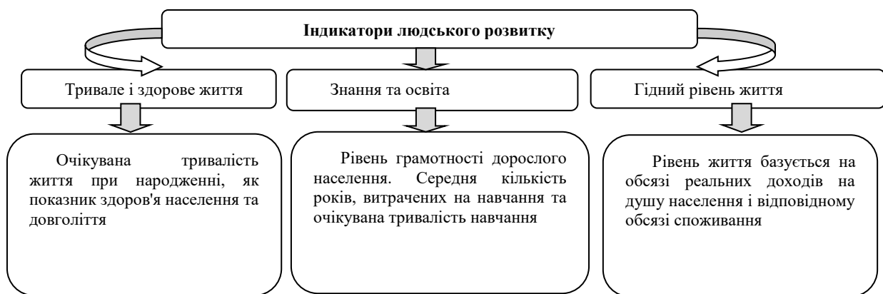
Рис. 3. Індекс людського розвитку

Серед щорічно оприлюднених показників «Human Development Indices» «Індекс людського розвитку» (ІЛР) враховує кількісні і якісні зміни суспільства за такими показниками, як валовий внутрішній продукт на душу населення, очікувана тривалість життя, грамотність та рівень зайнятості (рис.3).