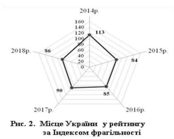
Рис. 2. Місце України у рейтингу за Індексом фрагільності