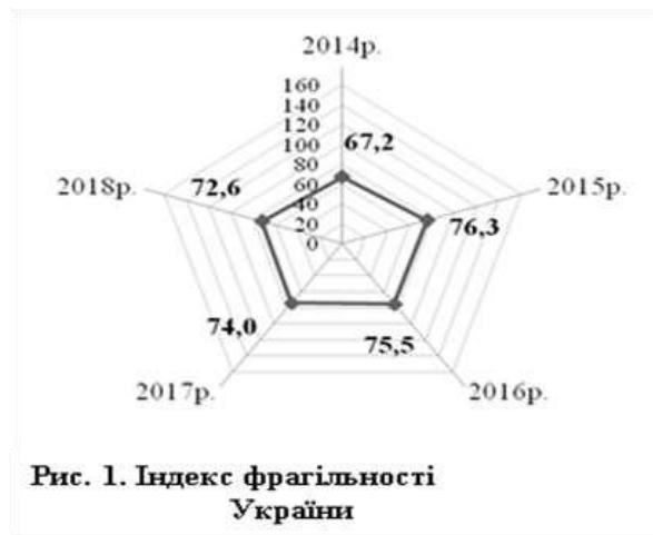
Рис. 1. Індекс фрагільності України

За Індексом недієздатності держави (Failed States Index), з 2014 року перейменованим в Індекс крихкості держав (The Fragile States Index) [10,11], який характеризує здатність (нездатність) держави контролювати цілісність своєї території, політичну, економічну та демографічну ситуацію в країні, а також сталість її державних інститутів, Україна отримала не найкращі результати, опинившись у складі нестабільних країн (рис. 1,2).