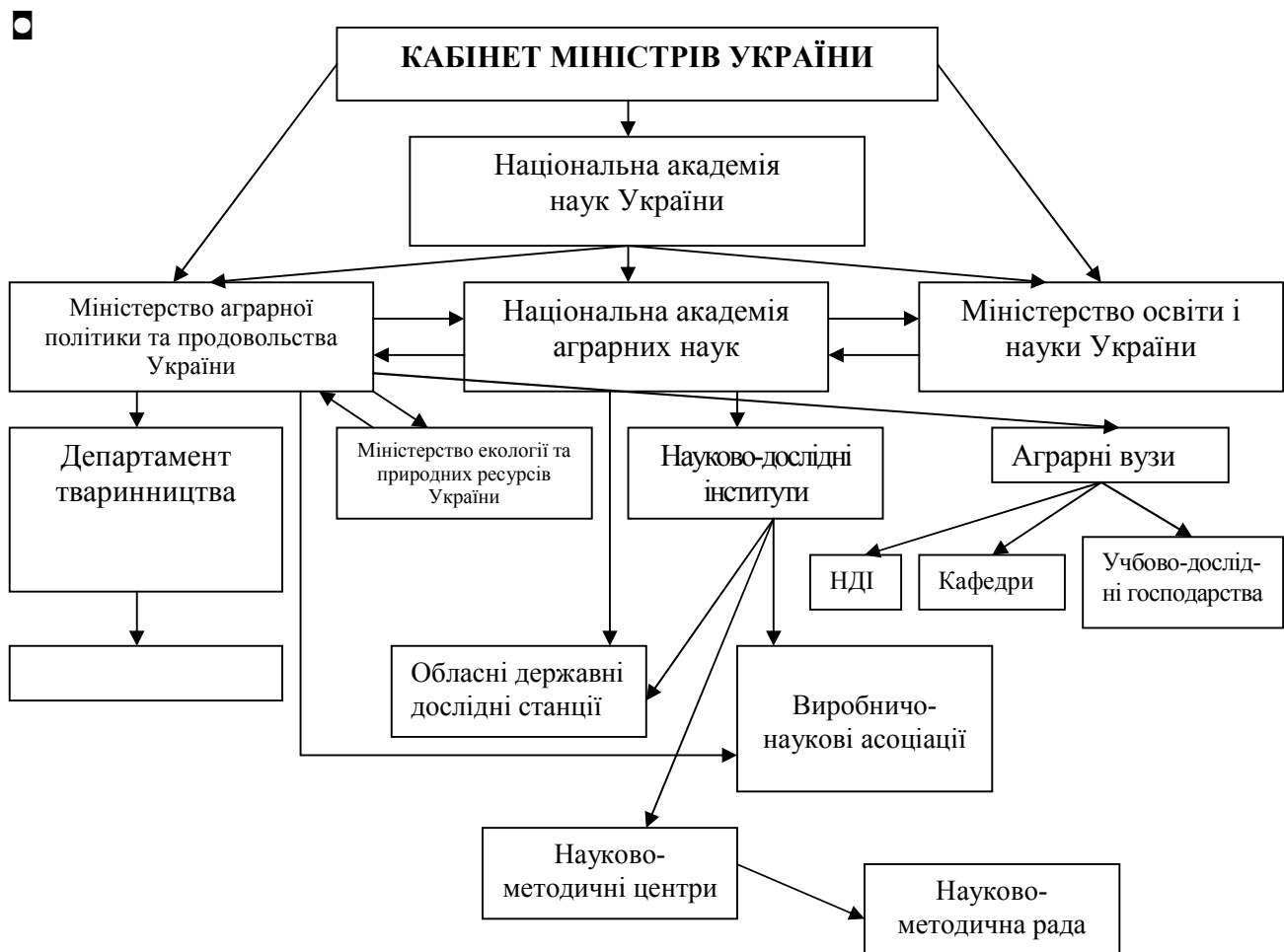
Рис. 2. Загальна система організації науково-дослідної роботи у тваринництві

В інститутах є відділи з лабораторіями розведення молочної худоби, дрібного тваринництва, конярства, технології кормів, технології виробництва молока, технології утримання худоби, зоотехнічної оцінки кормів та інші.