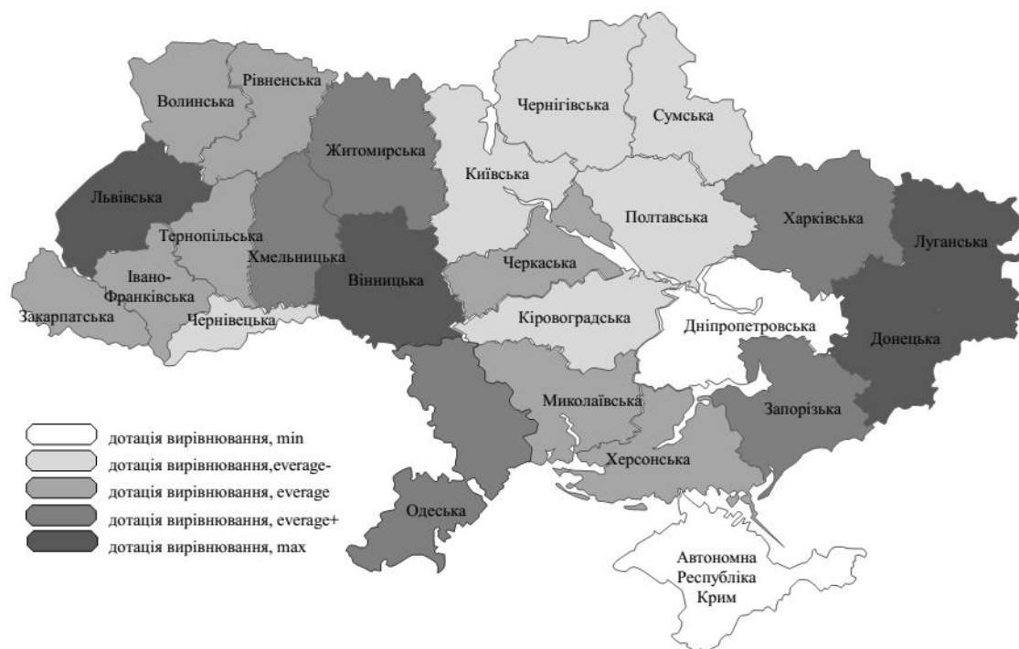
Рисунок 2 – Міжрегіональна диференціація горизонтального вирівнювання обласних бюджетів України у 2011-2014 роках

Джерело: побудовано авторами за даними Державної казначейської служби України [3]