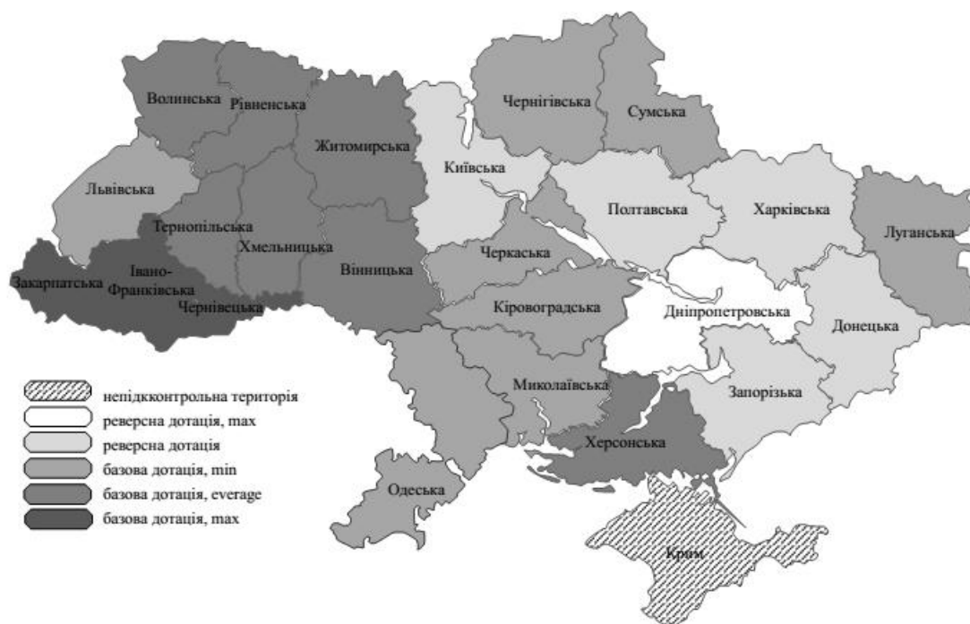
Рисунок 3 – Міжрегіональна диференціація горизонтального вирівнювання обласних бюджетів України у 2015-2017 роках

Джерело: побудовано авторами за даними Державної казначейської служби України [3]