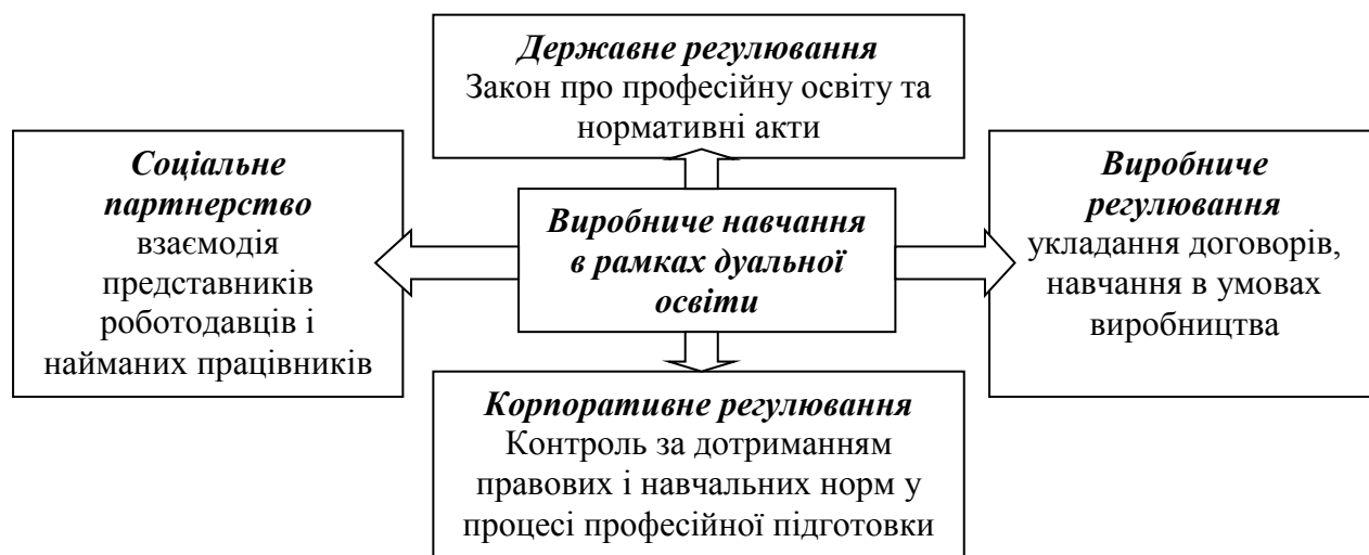
Рисунок 3 – Регуляторні механізми виробничого навчання в рамках дуальної освіти

підприємства та організації. Елементи такої освіти на сьогоднішній день вже застосовують в багатьох вітчизняних ВНЗ [5].