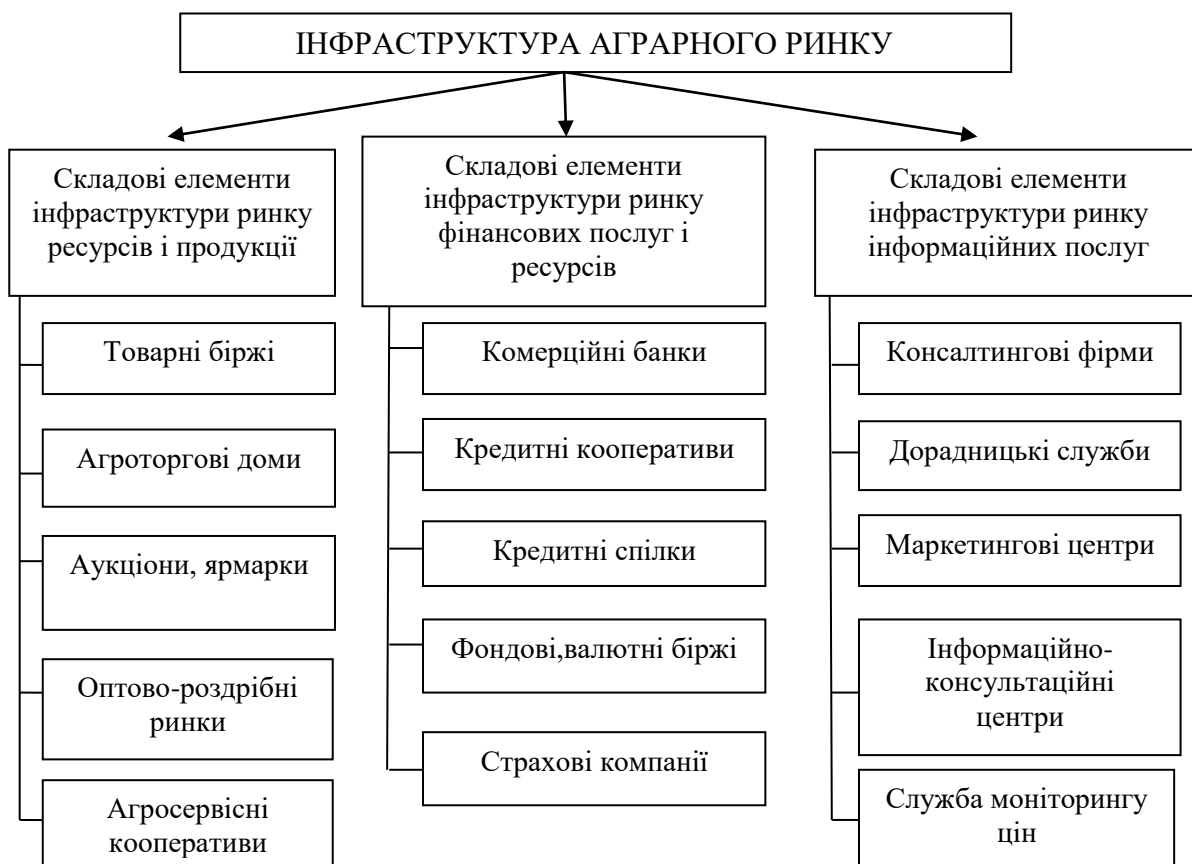
Рисунок 1 — Інфраструктурні елементи аграрного ринку

Забезпечення ефективної роботи аграрного сектора економіки та його конкурентоспроможності у значній мірі залежить від стану розвитку інфраструктури. Важливе місце у інфраструктурі аграрного ринку займає фінансове й інформаційне забезпечення (рис.1).