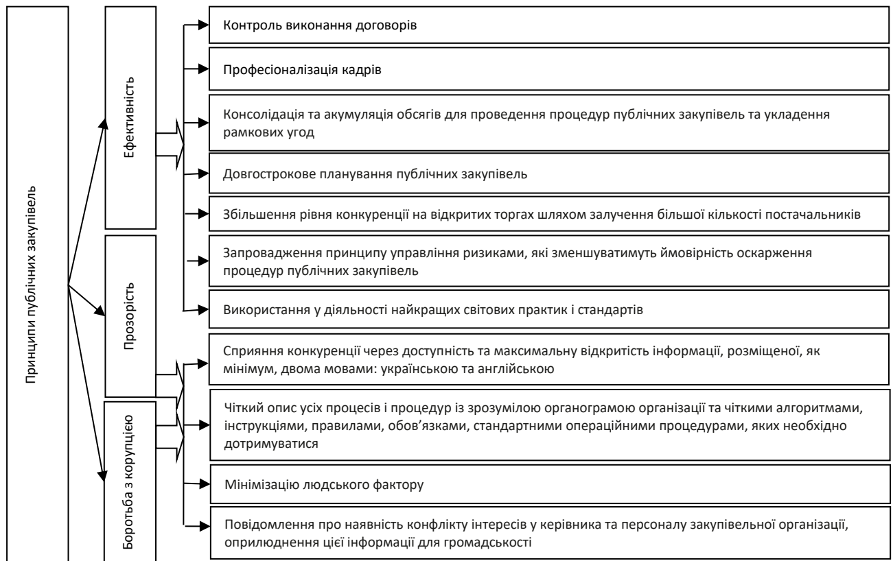
Рисунок 1 – Основні принципи публічних закупівель