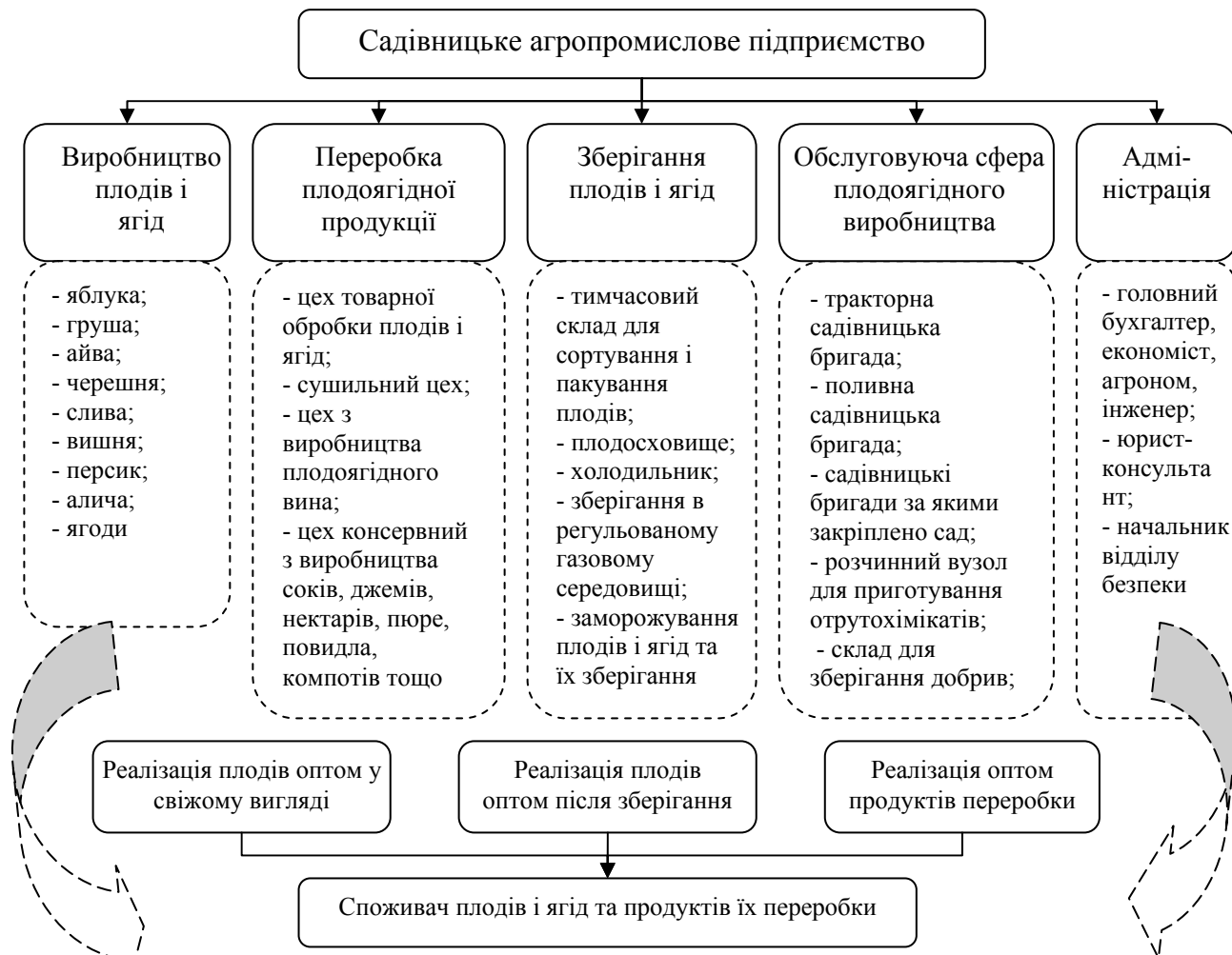
Рис. 1. Організаційно-господарська структура садівницького агропромислового підприємства

На основі опрацьованого вітчизняного і світового досвіду агропромислового комбінування пропонуються такі варіанти створення подібних організаційно-господарських структур у садівництві: садівницьких агропромислових підприємств (рис. 1); садівницьких агрофірм (рис. 2); контрактна інтеграція шляхом об'єднання економічних інтересів сільськогосподарських, переробних і торгівельних підприємств із залученням фінансових структур (рис. 3).