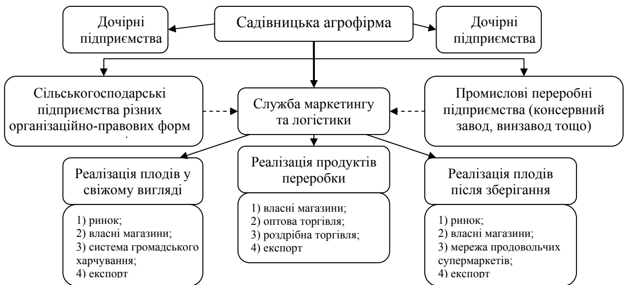
Рис. 2. Організаційно-господарська структура садівницької агрофірми ринкового типу

Зазначимо, що організаційно-господарська структурою створення садівницьких агрофірм має бути результат поглиблення інтеграційних процесів у низовій ланці агропромислового плодоягідного виробництва (рис. 2). Це передбачає розширення існуючих ланок ринкової інфраструктури, зокрема служб маркетингу, власної торгівельної мережі тощо.