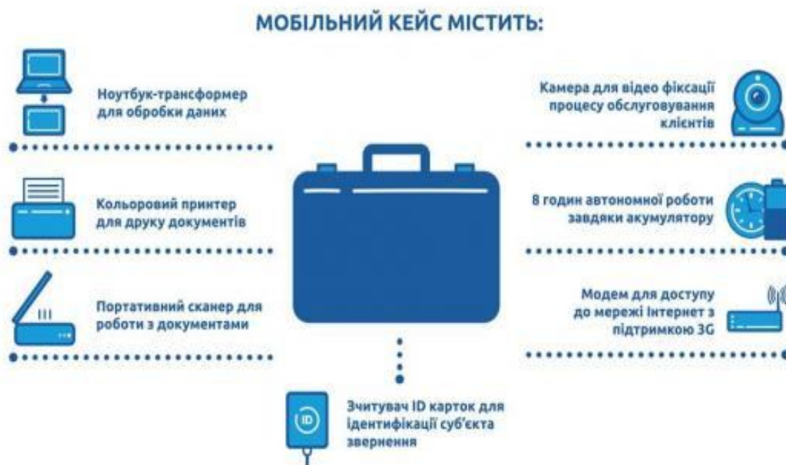
Рисунок 1 – Мобільний кейс