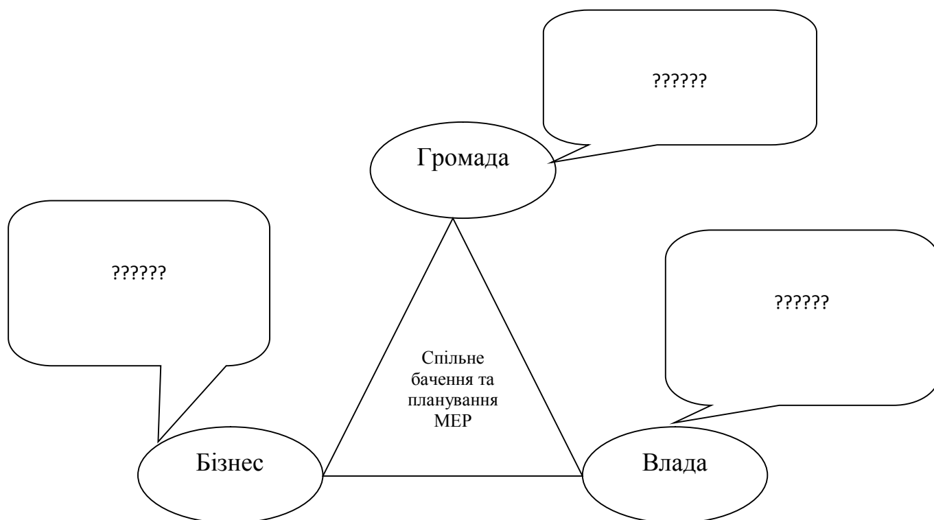
Рисунок 1. Класифікація інструментів планування моделей МЕР за компетентністю секторів

Завдання 6. Охарактеризуйте етапи становлення МЕР. Відповідь оформіть у вигляді таблиці 5.