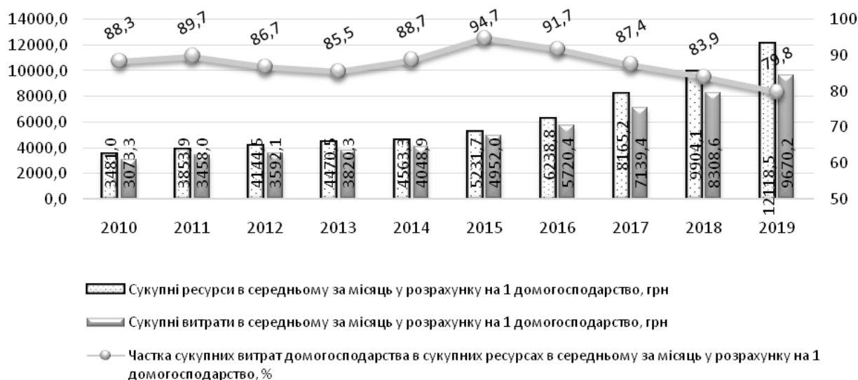
Рис. 2. Динаміка сукупних ресурсів та витрат у середньому за місяць у розрахунку на 1 домогосподарство

Фінансова безпека домогосподарств України тісно пов'язана з економічним добробутом населення [1, с. 79]. Своєю чергою добробут та якість життя домогосподарств визначаються наявними в них ресурсами (заробітна плата, доходи від діяльності, стипендії, пенсії, соціальні допомоги, грошова допомога від родичів чи інших осіб, пільги, субсидії та інші надходження), якими вони можуть вільно розпоряджатися, та витратами, які необхідні для забезпечення відповідного рівня умов життя населення. Розглянемо динаміку сукупних ресурсів та витрат у середньому за місяць у розрахунку на 1 домогосподарство та визначимо розмір частки сукупних витрат домогосподарства в обсязі сукупних ресурсів (рис. 2).