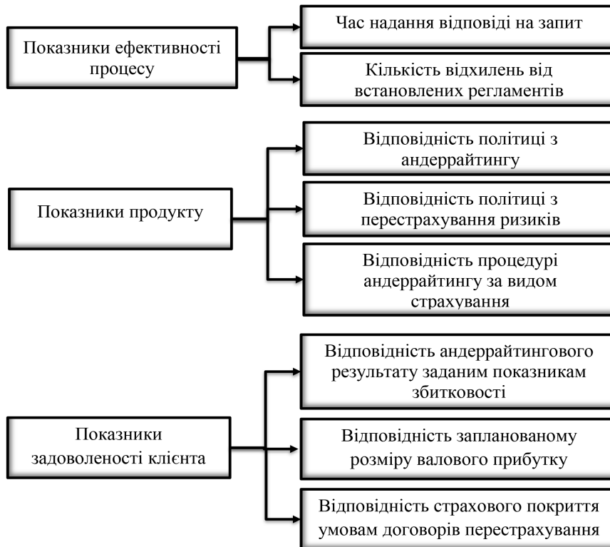
Рисунок 3 – Запропонована система показників для оцінки процесу андеррайтингу в страхових компаніях України

Для оцінювання результативності здійснення андеррайтингу на страхових компаніях необхідним є встановлення ключових показників результативності, які піддаються виміру. Нами запропонована система показників для оцінки процесу андеррайтингу в страхових компаніях України (рис. 3).