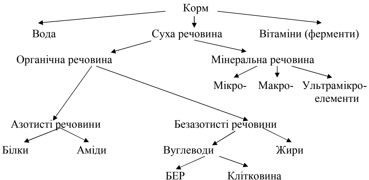
Схема хімічного складу рослинних кормів:

Завдання 1. Вивчити корми найбільш багаті та бідні за вмістом в них основних поживних речовин. На основі даних про хімічний склад кормів виписати корми з великим і малим вмістом кормових одиниць, протеїну, жиру, БЕР, клітковини, кальцію, фосфору та каротину (табл. 6) використовуючи додаток Д.