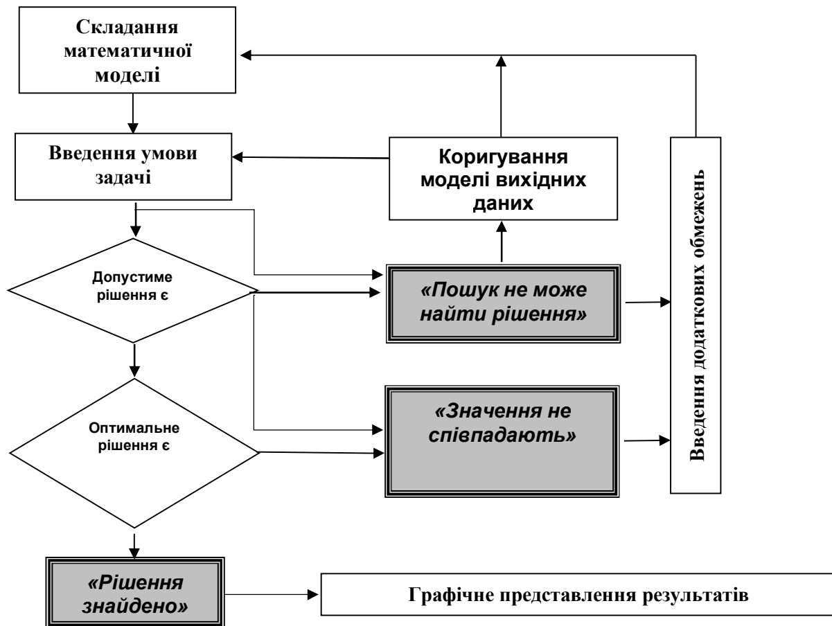
Рис. 1. Блок-схема вирішення задач методом лінійного програмування за допомогою MS Excel

При створенні бази даних поживності кормів, їх розподіляють у відповідні, групи згідно класифікації (концентровані, грубі, соковиті та ін.). Поживність кормів використовують або з відповідних довідників, або фактичну на підставі зоохімічного аналізу кормів.