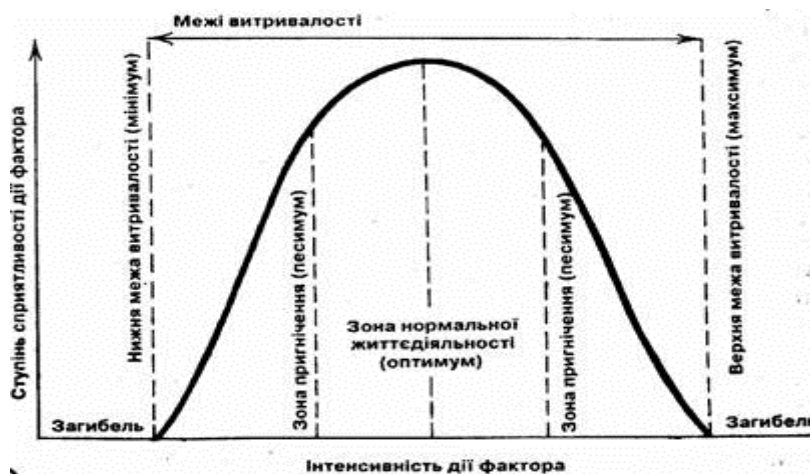
Рис.1. Схема дії екологічного чинника

максимумом , реагуючи аналогічно на обидва песимальних значення фактора.