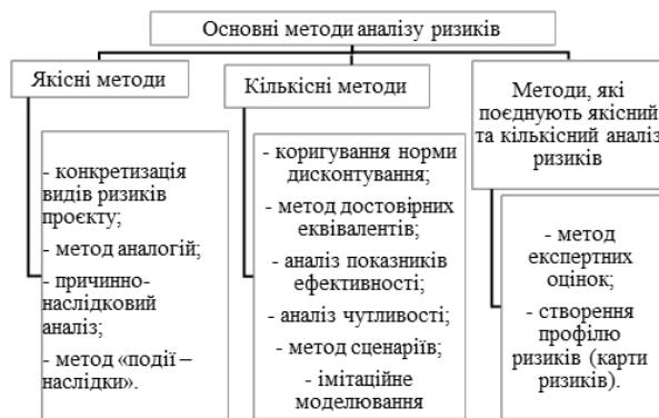
Рисунок 3 – Основні методи аналізу ризиків проєктів

Методи аналізу ризиків проєктів поділяють на якісні та кількісні. Представимо перелік основних методів на рис.3.