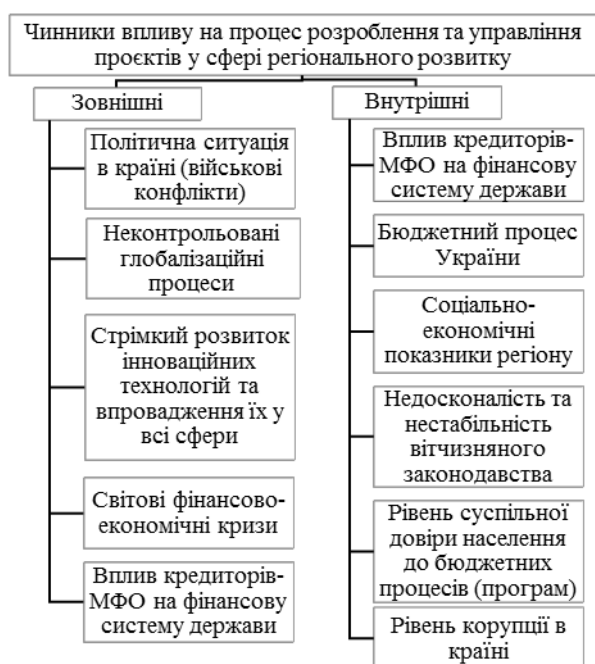
Рисунок 1 – Основні чинники впливу на процес розроблення та управління проєктною діяльністю

На основі експертного опитування, проведеного серед працівників органів місцевого самоврядування, здійснено SWOT-аналіз процесу розроблення та управління проєктів у сфері регіонального розвитку, результати якого узагальнено в табл. 1.