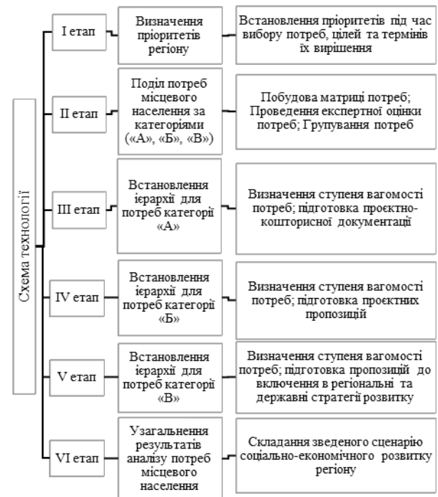
Рисунок 5 – Технологія фіксації соціально-економічних потреб населення із використанням методів встановлення пріоритетів

Технологія вияву та фіксації соціально-економічних потреб місцевого населення із використанням методів встановлення пріоритетів та аналізу ієрархій схематично представлена на рис. 5.